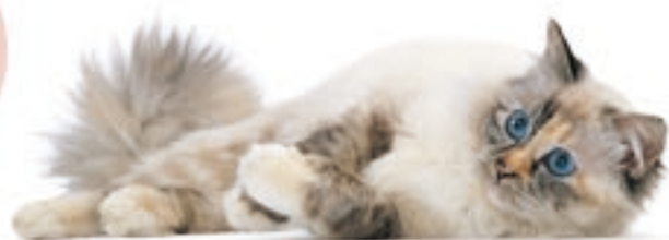
Sacré de Birmanie